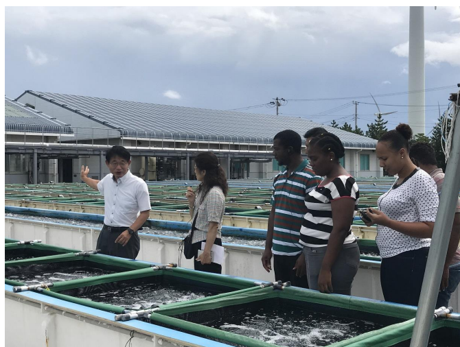
< Formação em Gestão das Pescas em 2018 Japan >