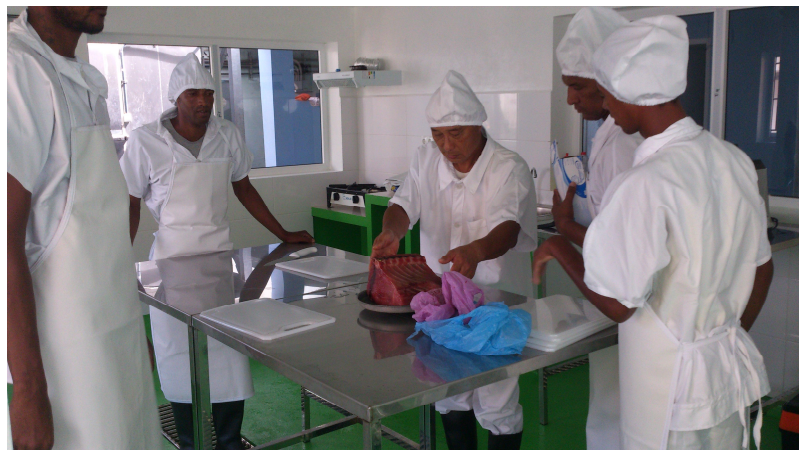
< Salamansa São Vicente em 2018 >