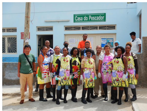
< Salamansa, São Vicente em 2018 >