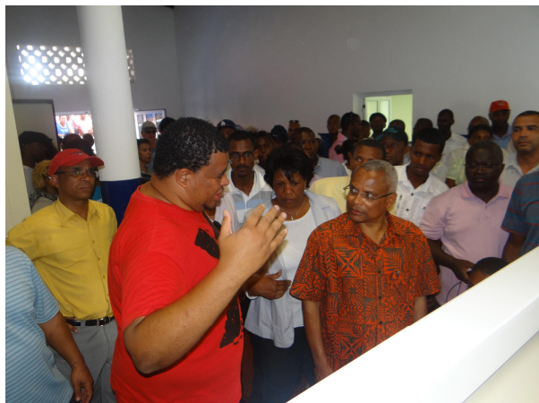
< Tarrafal de monte trigo, Santo Antão em 2013 >