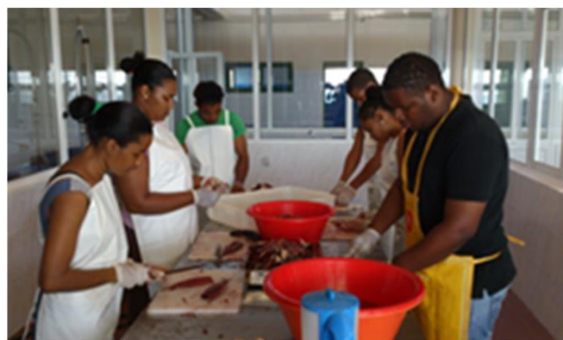
< Porto novo, Santo Antão em 2014 >