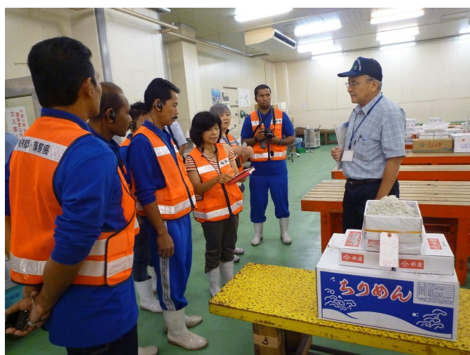
< Formação em Gestão das Pescas em 2013 >